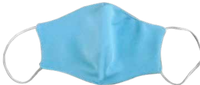
WH-TX2421 3 CAPAS GRANDE