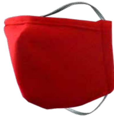
WH-TX2420 MED TAMAÑO JUNIOR