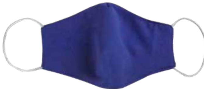
WH-TX2422 2 CAPAS GRANDE