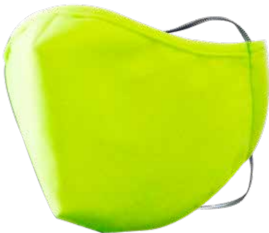
WH-TX2420 XL TAMAÑO EXTRA GRANDE