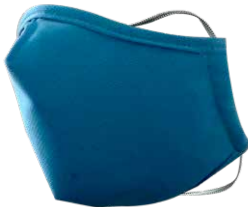
WH-TX2420L TAMAÑO GRANDE