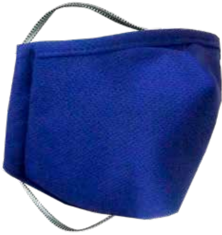
WH-TX2420 MED TAMAÑO JUNIOR