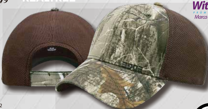
EDGE 02 CAMO MESH BROWN

WitHouse ® PROMO DESIGN Marca con ingenio