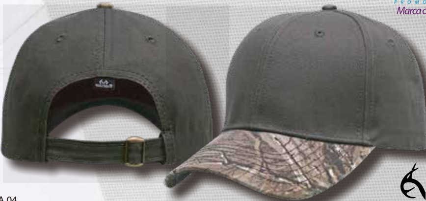
XTRA 04 CAMO PEAK OLIVE