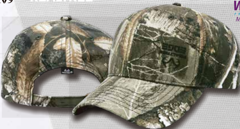
EDGE 01 CAMO PLAIN