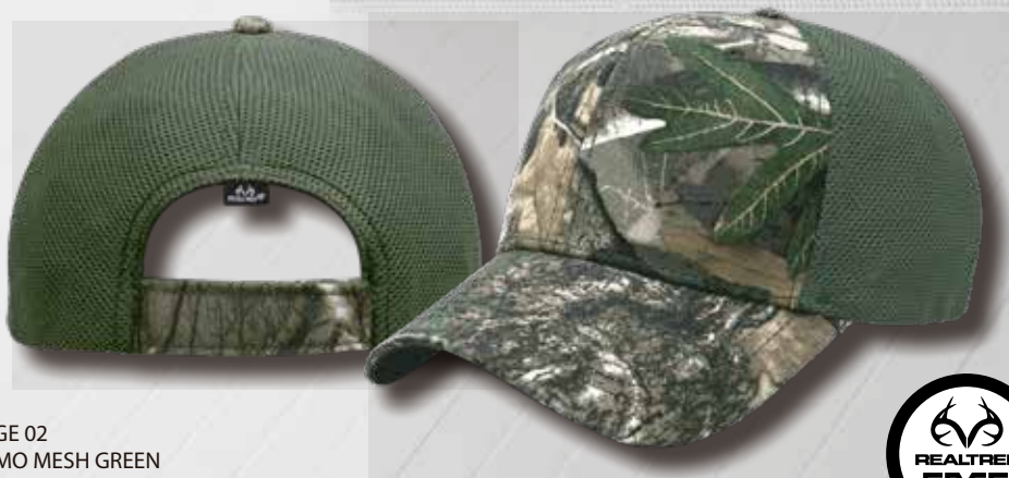
EDGE 02 CAMO MESH GREEN