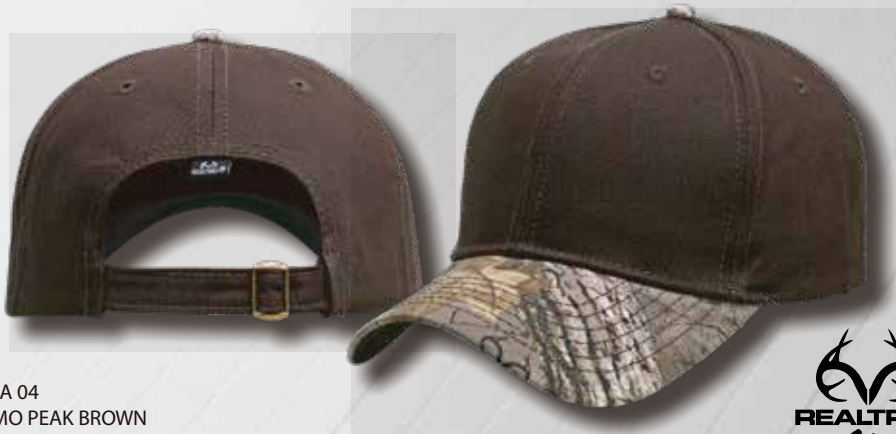
XTRA 04 CAMO PEAK BROWN