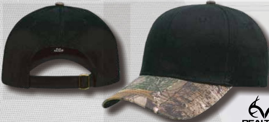
XTRA 04 CAMO PEAK BLACK