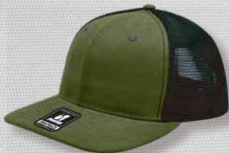
DK GREEN BLACK