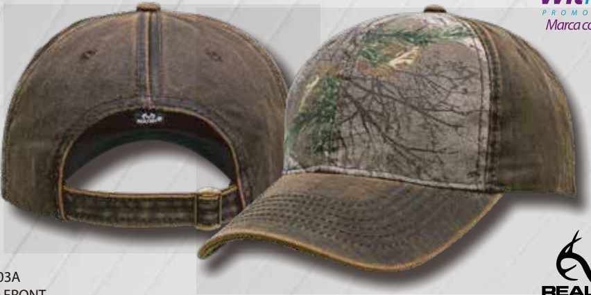
XTRA 03A CAMO FRONT

WitHouse ® PROMO DESIGN Marca con ingenio