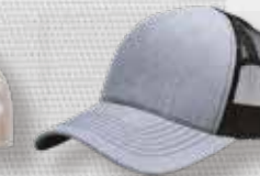
HEATHER GREY/ BLACK