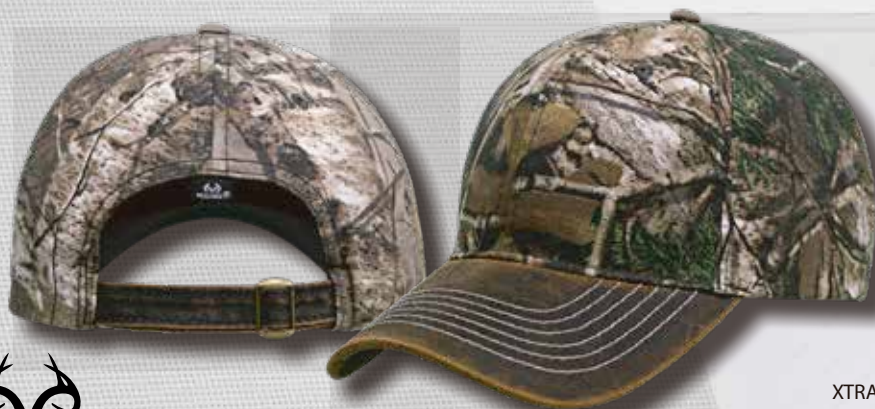
XTRA 03 CAMO CROWN