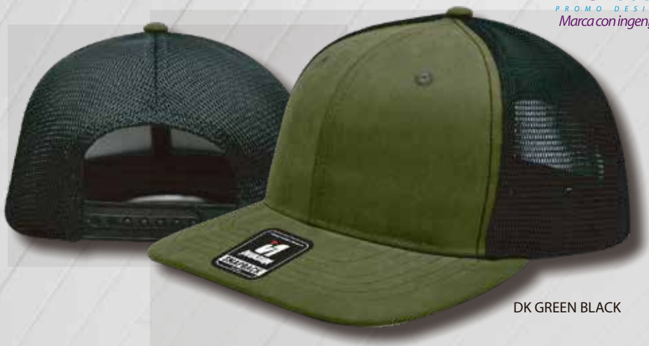
DK GREEN BLACK