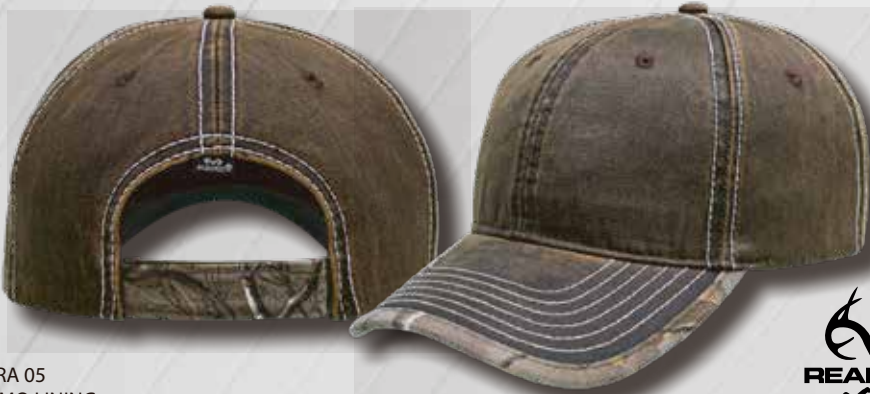
XTRA 05 CAMO LINING

Horma: M-PRO / Perfil Medio. Estructura: Sin estructura / Suave. Tipo de Tela: Algodón encerado, ribete en visera tela Realtree Composición: 90% Algodón, 8% Poliéster, 2% Poliuretano Tipo de broche / ajustador: Velcro ajustable. Visera: Pre curvada. Circunferencia: Unitalla Ajustable. Banda de sudor: Algodón.