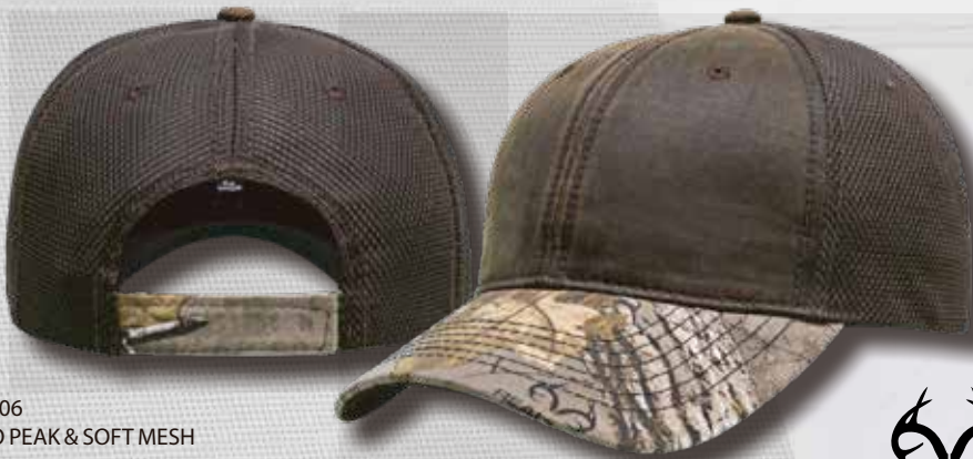
XTRA 06 CAMO PEAK & SOFT MESH

Horma: M-PRO / Perfil Medio. Estructura: Sin estructura / Suave. Tipo de Tela: Paneles frontales algodón encerado, Visera 60% Algodón, 40% poliéster tela Real tree, Malla Micro perforada suave. Composicion: 55% Poliéster, 43% Algodón, 2% Poliuretano Tipo de broche / ajustador: Velcro ajustable. Visera: Pre curvada. Circunferencia: Unitalla Ajustable.